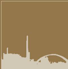
Porto Marghera, skyline, XIX sec.