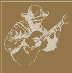
gaucho con chitarra, XIX sec.