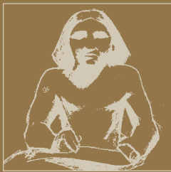
scriba egiziano, ca 2400 a.C.