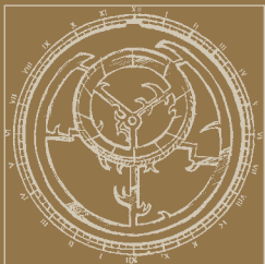
astrolabio, XVI sec.