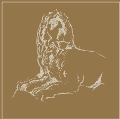
arsenale di Venezia statua leonina, XVII sec.