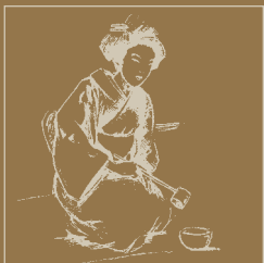
cerimonia del tè, giappone.