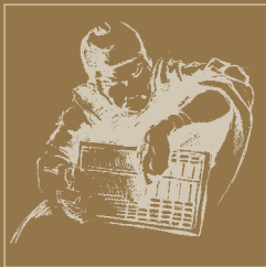
abaco cinese, XIII sec.