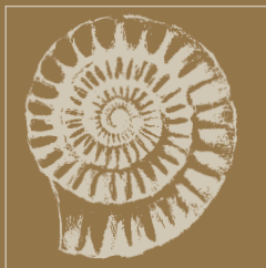
ammonite fossile, periodo cretaceo.